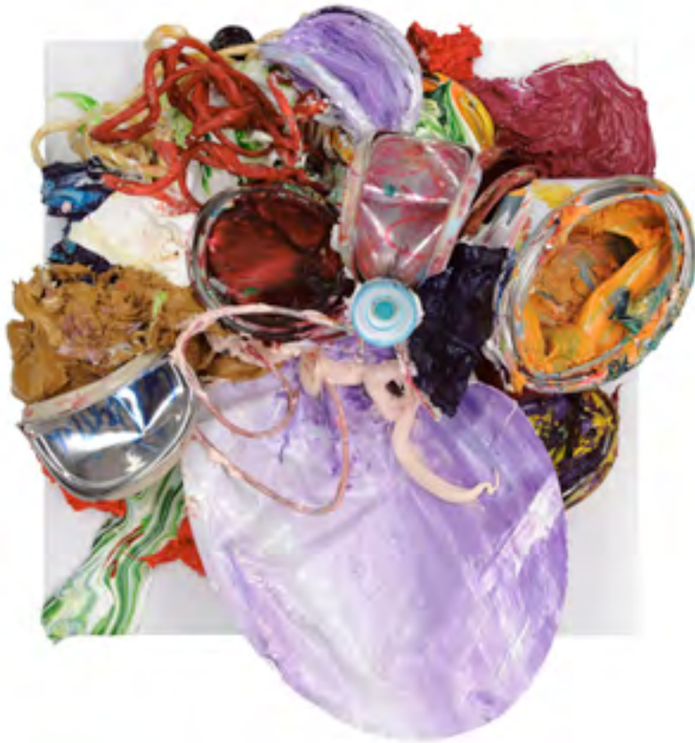
Lucky Choice (24), Öl und Ateliermaterial auf Holz, 35 x 33 x 11 cm, 2010

Schambeck jedoch nahm nicht etwa spezielle Miniaturmodelle, sondern er griff sich das, was der Künstler immer gerade zur Hand hat: Dosen, Tuben, Folien usw. Und beinahe wie selbstverständlich führte der künstlerische Arbeitsweg weg vom Basteln übers Fabrizieren hin zum Gestalten.