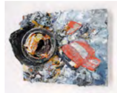
Speed Up, Öl, Farbdose und Aluminiumblech auf Holz, 20 x 25 x 8 cm, 1999

Die Tatsache, dass klassische Votivbilder manchmal dingliche Einarbeitungen enthalten, mag den Künstler dazu angeregt haben, ähnliches selbst zu unternehmen. Dass er damit zugleich den Bildraum gesprengt hat, ist einerseits wohl dem häufig explodierenden Motiv geschuldet, andererseits aber auch eine Folge der angesichts des Themas argen Begrenztheit der Formate.