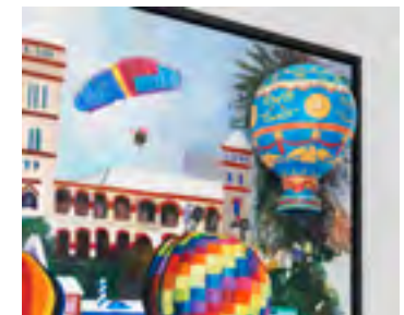
Detail aus einem Bild von Malcolm Morley

Das Einbringen von Objekten in realistische Bilder ist nicht die ureigene Erfindung von Jochen Schambeck. Auch bei Malcolm Morley finden sich schon eingearbeitete Flugzeuge, Züge und sogar Ballons in den späten Bildern.