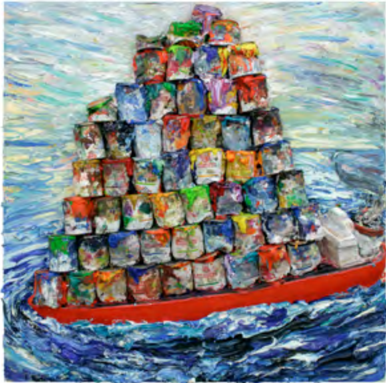
Well-Oiled (22), Öl, Farbdosen und Montageschaum auf Holz, 120 x 120 x 13 cm, 2005

Und diese Verbindung ist das kompositionelle Konzept – in Gestalt einer ironischen Vermassung. Diese Idee erfasst man am besten visuell: dieselben Farbdosen, die wir in Well-Oiled (22) als Schiffscontainerüberladung sehen, finden wir in den „Grow Out“ und den „Make Up“-Arbeiten als morphologische Formen wieder. Diese Arbeiten haben fließenden Bildwitz - auf ironischem Grund.