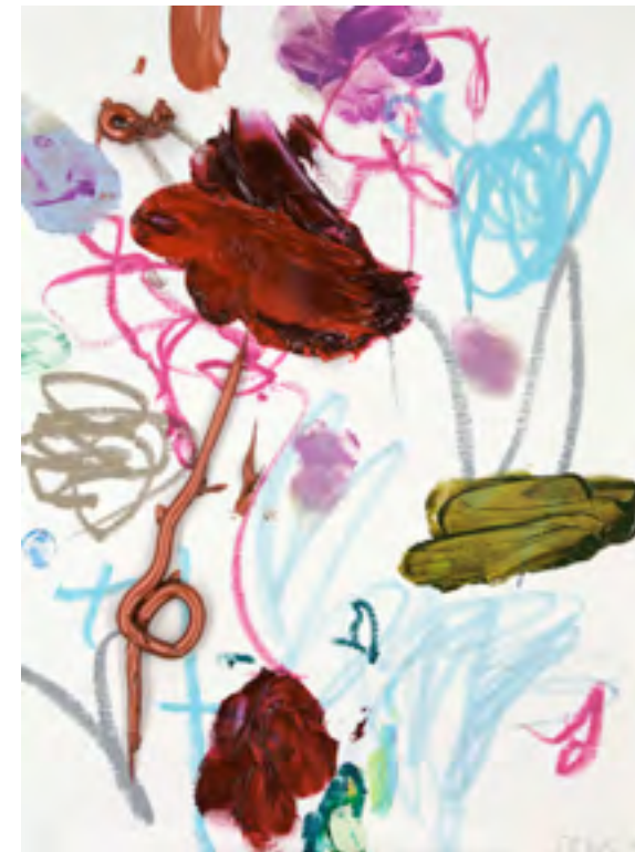
Draw Up (58), Öl und Ölkreide auf Papier, 33 x 24 cm, 2014

Zugleich jedoch erhebt seine enthemmte materielle Fülle ebenso wie seine farbige Üppigkeit das Schambecksche Objekt zum Symbol für die unendliche Großzügigkeit der Kunst – ein überaus tröstlicher Gedanke. Dieses sinnestäuschende Phänomen des scheinbaren Erkennens - statt des Erkennens des Scheins - machen sich Maler seit langer Zeit zunutze. So gibt es in spätimpressionistischen Blumenbildern häufig mehr Blüten als Stängel. Jochen Schambeck aber ist beileibe kein Spätimpressionist. Denn er treibt das Phänomen auf seine eigene Weise immer und immer wieder auf die Spitze. Auf den neuen Papierarbeiten der „Draw Up“-Serie finden sich nichts als abstrakte Farbkringel und Ölfarbbatzen – und doch sehen wir sie als Blumenstücke!