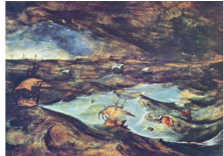
Pieter Brueghel: Seesturm, 1610/1615, Kunsthistorisches Museum Wien

„Der Seesturm“ von Pieter Brueghel 2 – in dem Walfänger die aufgebrachtten Wellen mit Öl zu besänftigen versuchen.