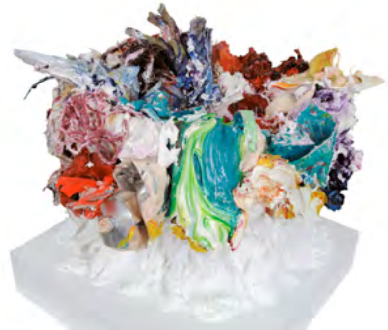
Make Up 3D direct (14), Öl und Ateliermaterial auf Holzkasten, 32 x 35 x 34 cm, 2009

Genau ab diesem Punkt beginnt - in den Assemblagen - der gesamte künstlerische Arbeitsprozess in das Werk einzufließen – im Sinne des Wortes. Das Atelier in seiner Totalität strahlt aus diesen Arbeiten zurück – und beide bedingen einander radikal wechselseitig. So entstehen Bilder, zumeist eher Objekte, die sich vom motivischen Anlass befreit haben, aber dafür quasi total mit dem Atelier verwachsen sind. Sie haben als Folge ihres schieren Farbvolumens ein zähes Eigenleben das nur langsam zur Ruhe kommt: vom Schaffensprozess zum vollendeten Werk ist es ein zumeist monatelanger Weg. Oftmals sind sie so schwer, dass es mancher Anstrengung bedarf, sie überhaupt aus dem Atelier zu bergen - das betont noch ihren künstlerisch existentiellen Charakter. Und der scheinbare Unterschied zwischen Bild und Objekt wird letztlich uninteressant.