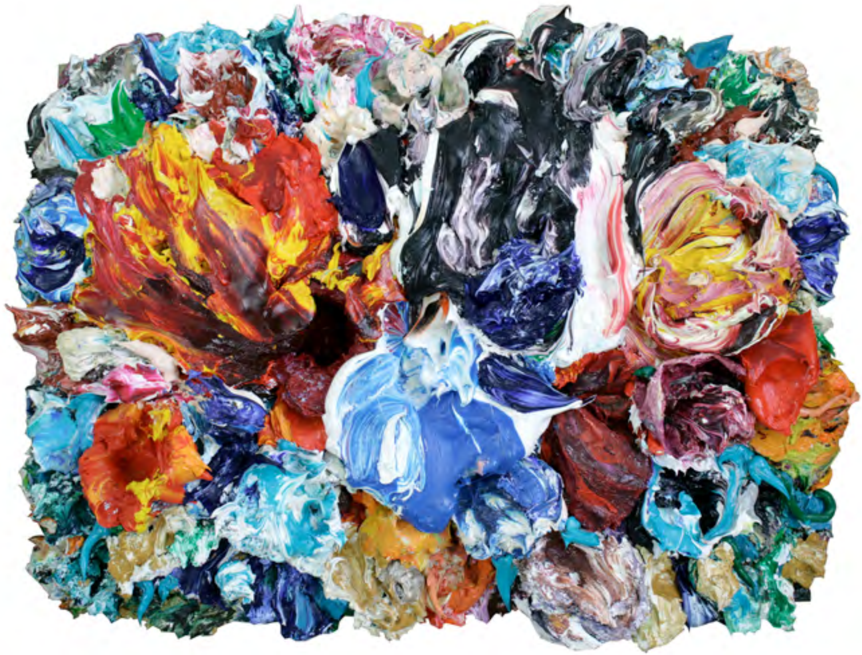
Make Up (57), Öl und Ateliermaterial auf Holz, 50 x 65 x 13 cm, 2005/08