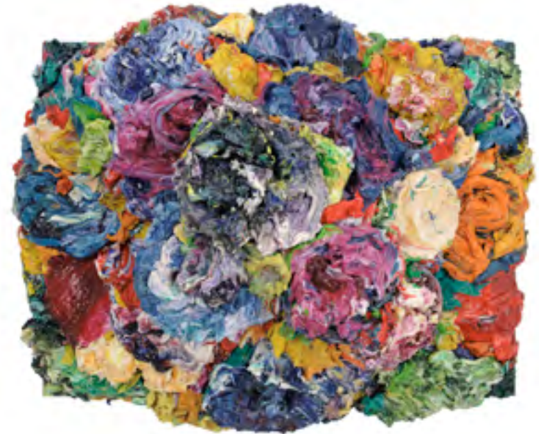
Grow Out (31), Öl und Farbdosen auf Holz, 36 x 43 x 19 cm, 2001

Die Komposition ist das eine – das Motiv und seine Darstellung ist das andere.