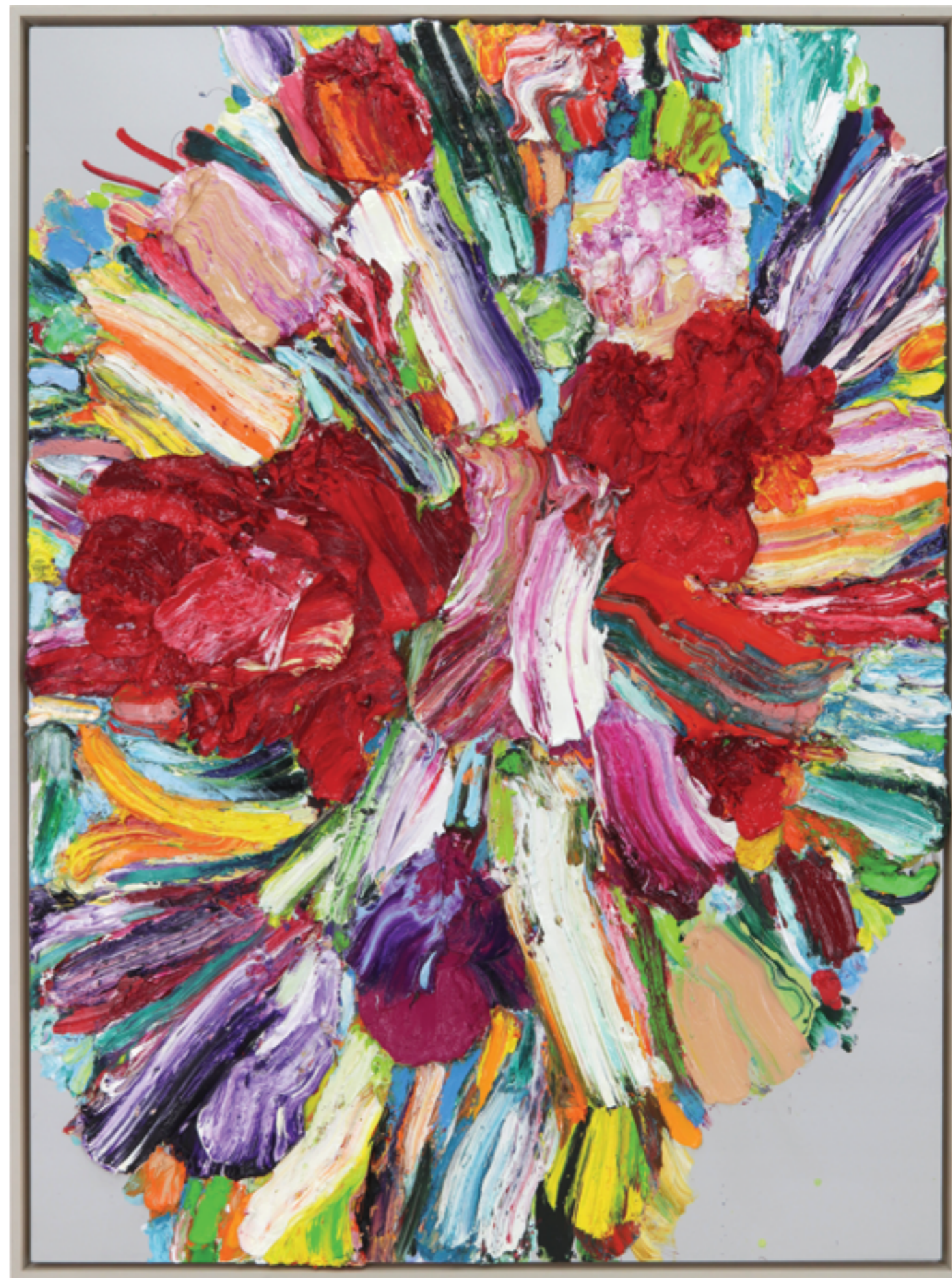
Pour Out (25), oil and lacquer on plywood, 172 x 127 x 6 cm, 2016/23