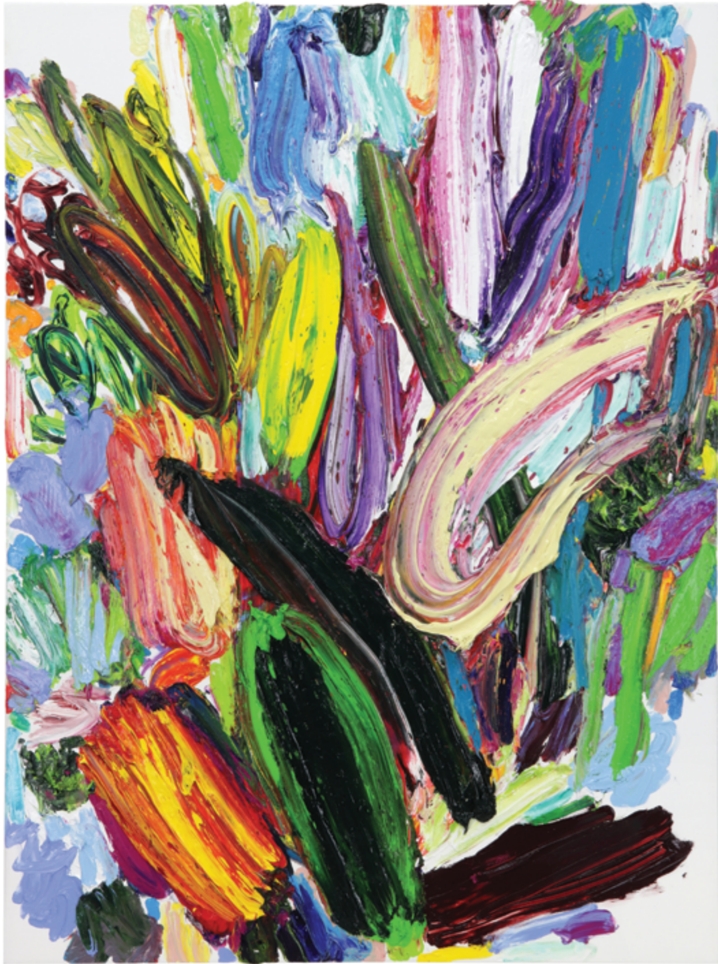
Jochen Schambeck overpaintings