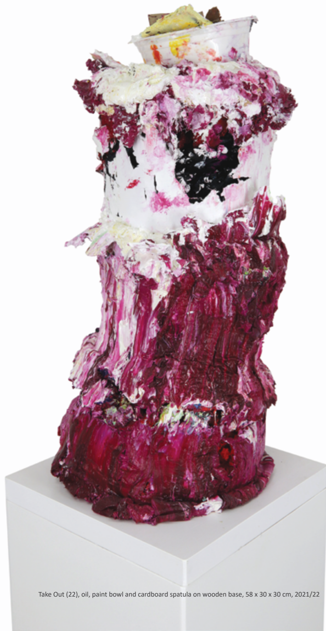
Take Out (22), oil, paint bowl and cardboard spatula on wooden base, 58 x 30 x 30 cm, 2021/22