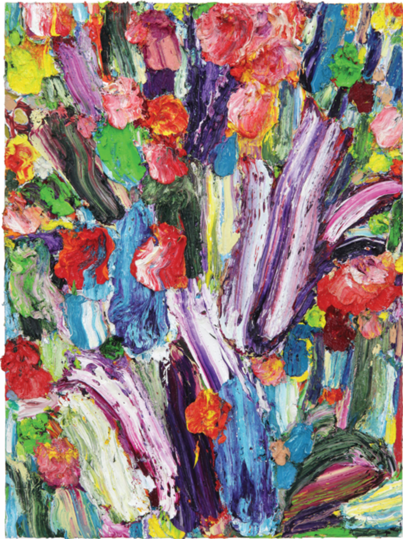
Dedication (44), oil on canvas, 176 x 132 x 5 cm, 2022/23

For the viewer, undoubtedly carried away and overwhelmed by the vehemence and force of the color, it is worth remembering at this point the general term under which Schambeck subsumes all of the above-mentioned picture titles and meanings: they are apostrophized as “overpaintings”. “Overpainting” may seem irritating at first, but it is associated with – if not cancellation or removal – at least correction or improvement. But why would the artist want to paint over these powerful paintings of his?