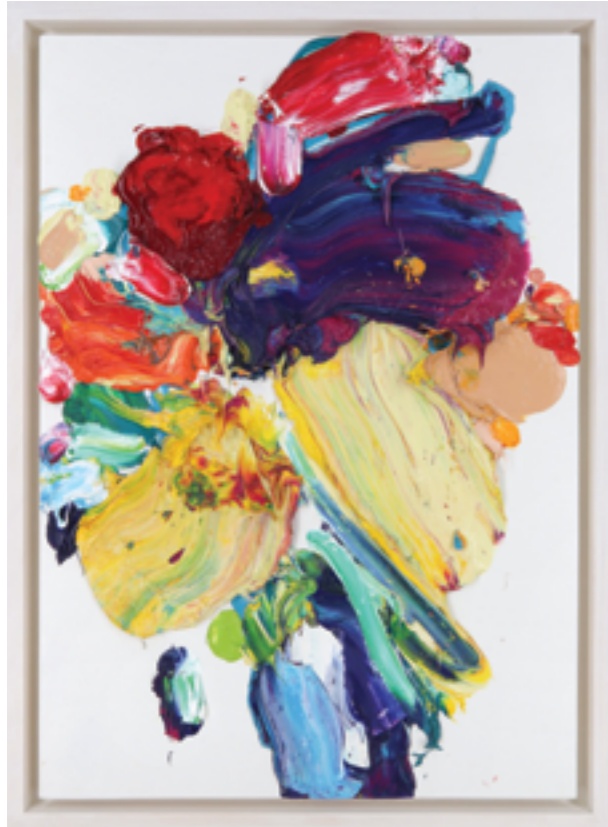
Lay Out (526), oil on plywood, 60 x 42 x 5 cm, 2022/23