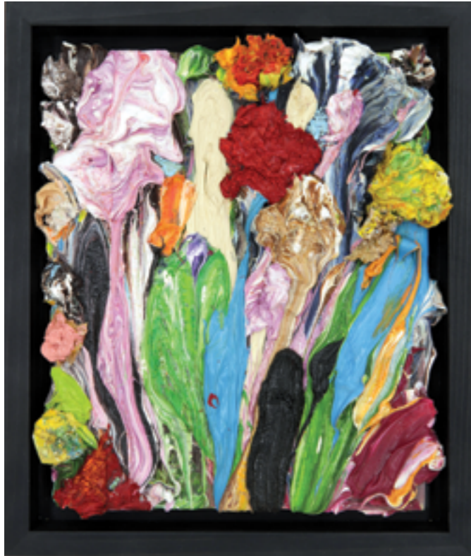
Splash Out (35), oil on plywood, 28 x 25 x 5 cm, 2010/22