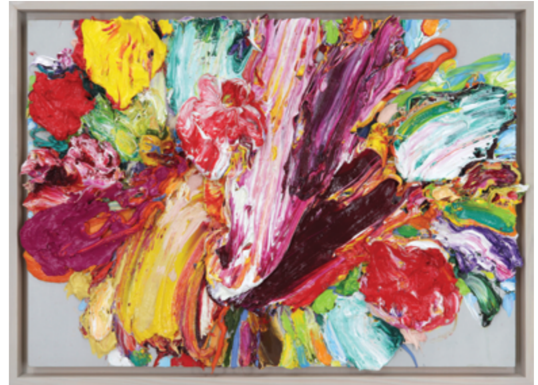
Lay Out (141), oil on plywood, 63 x 90 x 5 cm, 2013/22/23