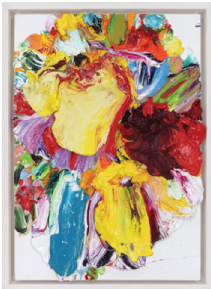
Lay Out (508), oil on plywood, 60 x 43 x 5 cm, 2022