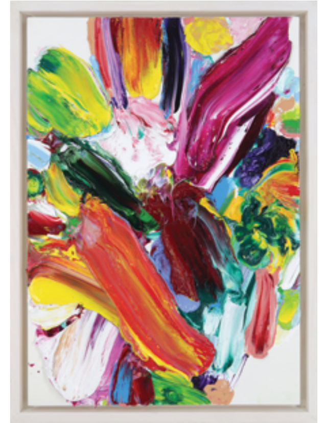
Lay Out (531), oil on plywood, 60 x 42 x 4 cm, 2023