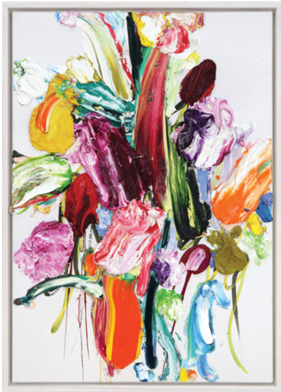
Lay Out (485), oil on canvas, 100 x 70 x 5 cm, 2019/23