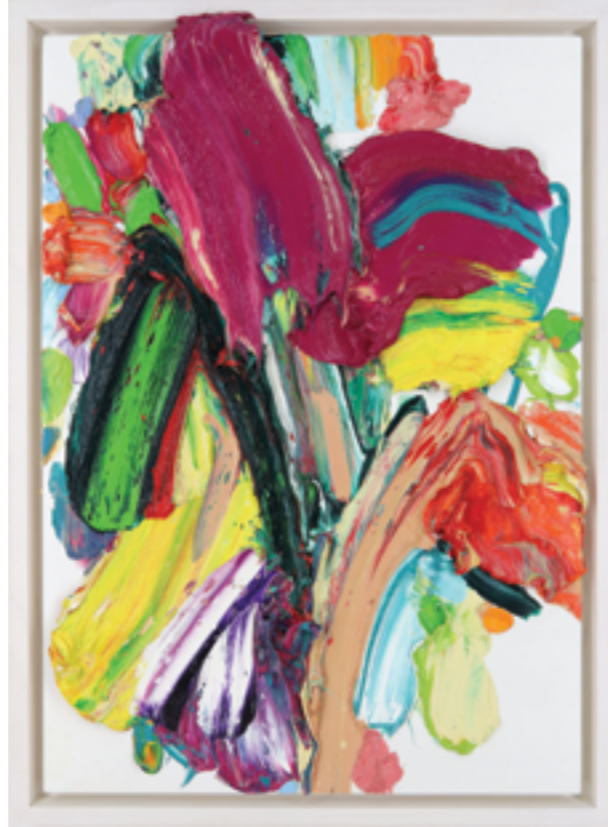
Lay Out (524), oil on plywood, 62 x 42 x 5 cm, 2022/23