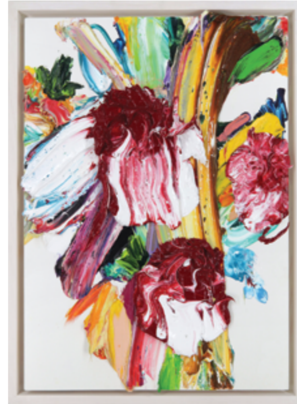
Lay Out (523), oil on plywood, 61 x 42 x 6 cm, 2022/23