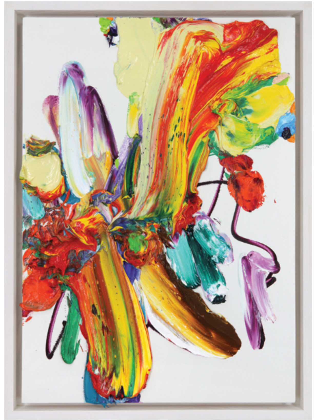
Lay Out (521), oil on plywood, 60 x 42 x 5 cm, 2022