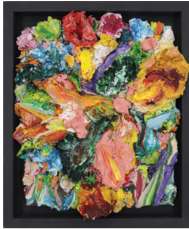
Splash Out (50), oil on plywood, 29 x 25 x 6 cm, 2010/15/22