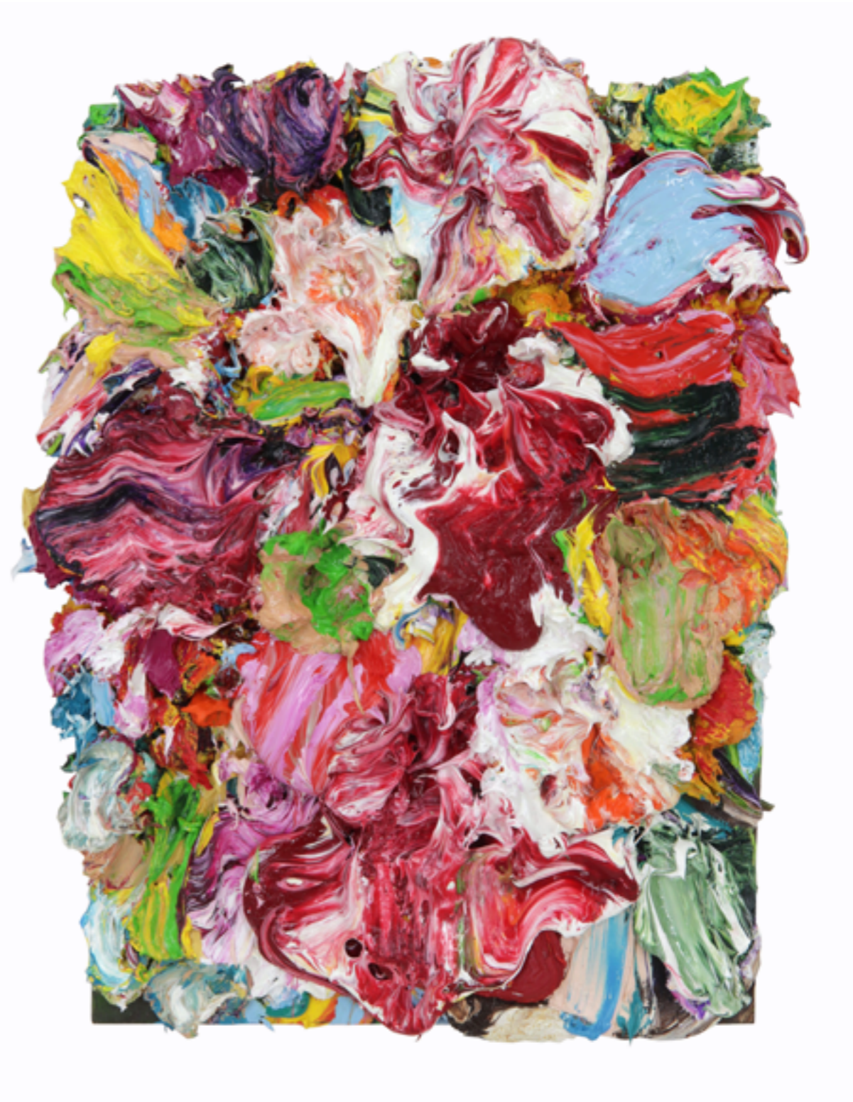
Splash Out (44), oil and studio material on plywood, 65 x 49 x 10 cm, 2010/22/23