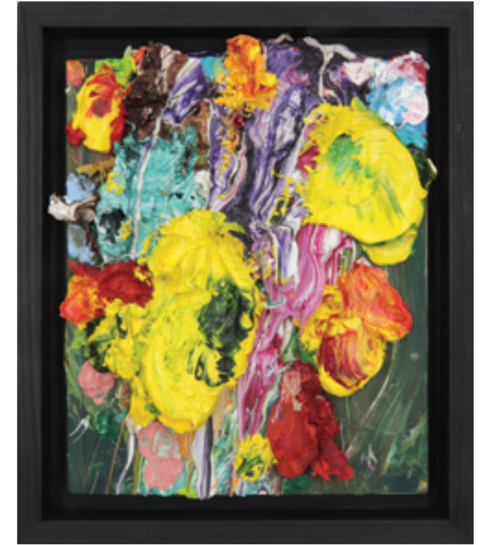
Splash Out (64), oil on plywood, 27 x 22 x 5 cm, 2011/22