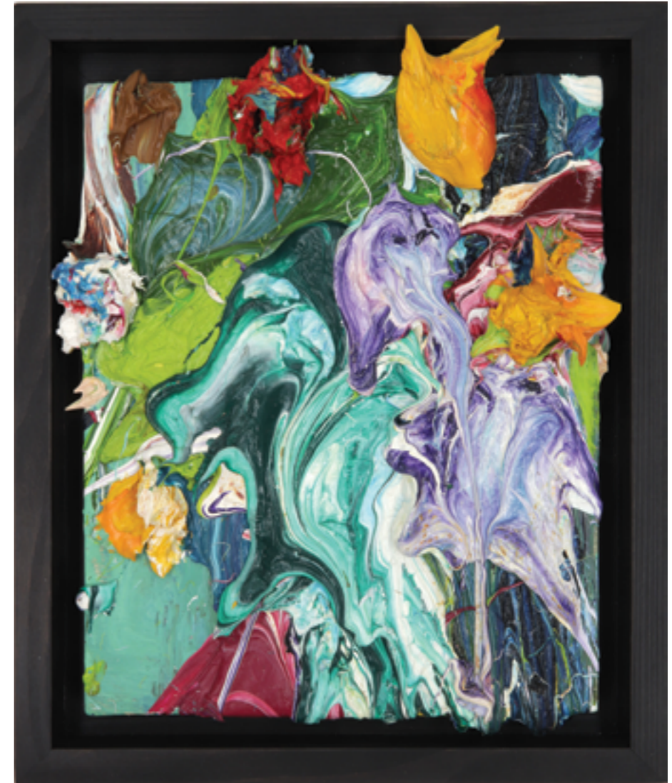
Splash Out (47), oil on plywood, 28 x 23 x 4 cm, 2010