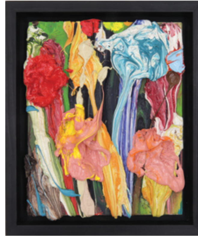
Splash Out (21), oil on plywood, 27 x 22 x 3 cm, 2010/22