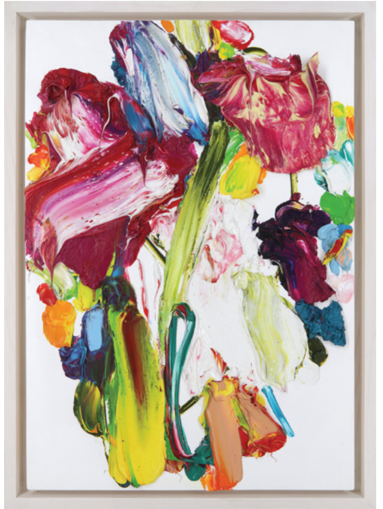
Lay Out (515), oil on plywood, 60 x 42 x 4 cm, 2022/23