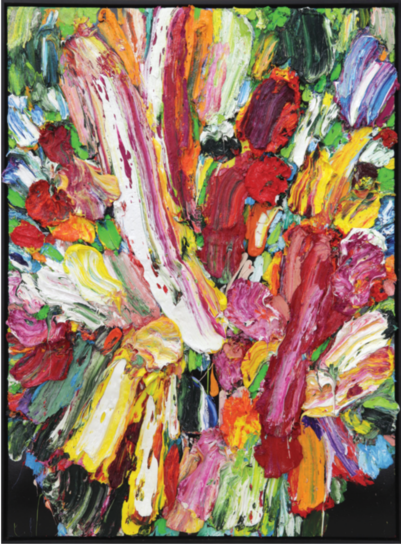
Lay Out (188), oil on plywood, 173 x 129 x 8 cm, 2013/22/23