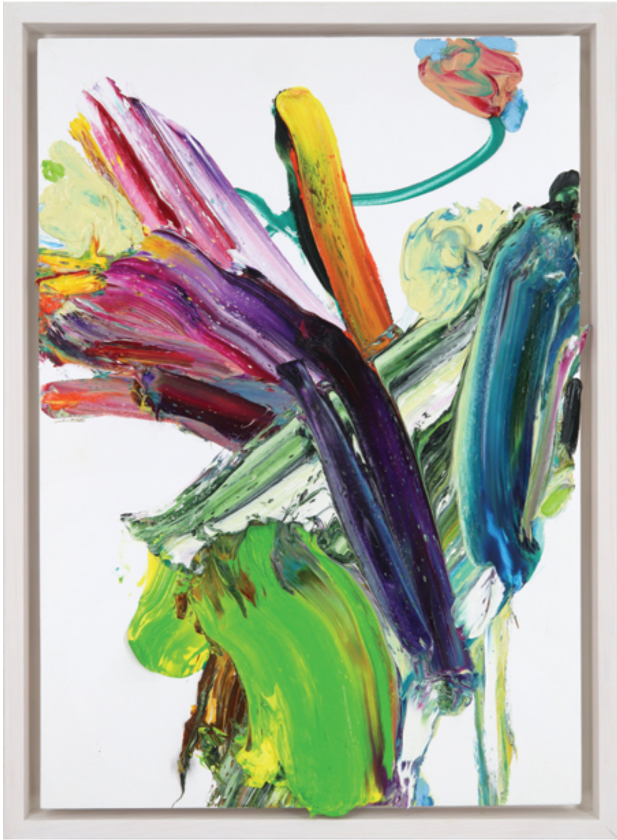
Lay Out (520), oil on plywood, 61 x 42 x 3 cm, 2022